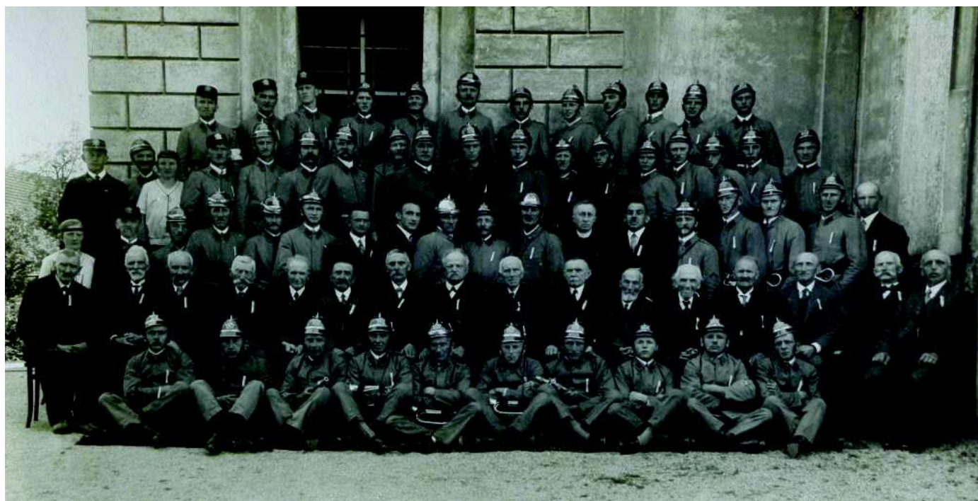
Hasiči rok 1934