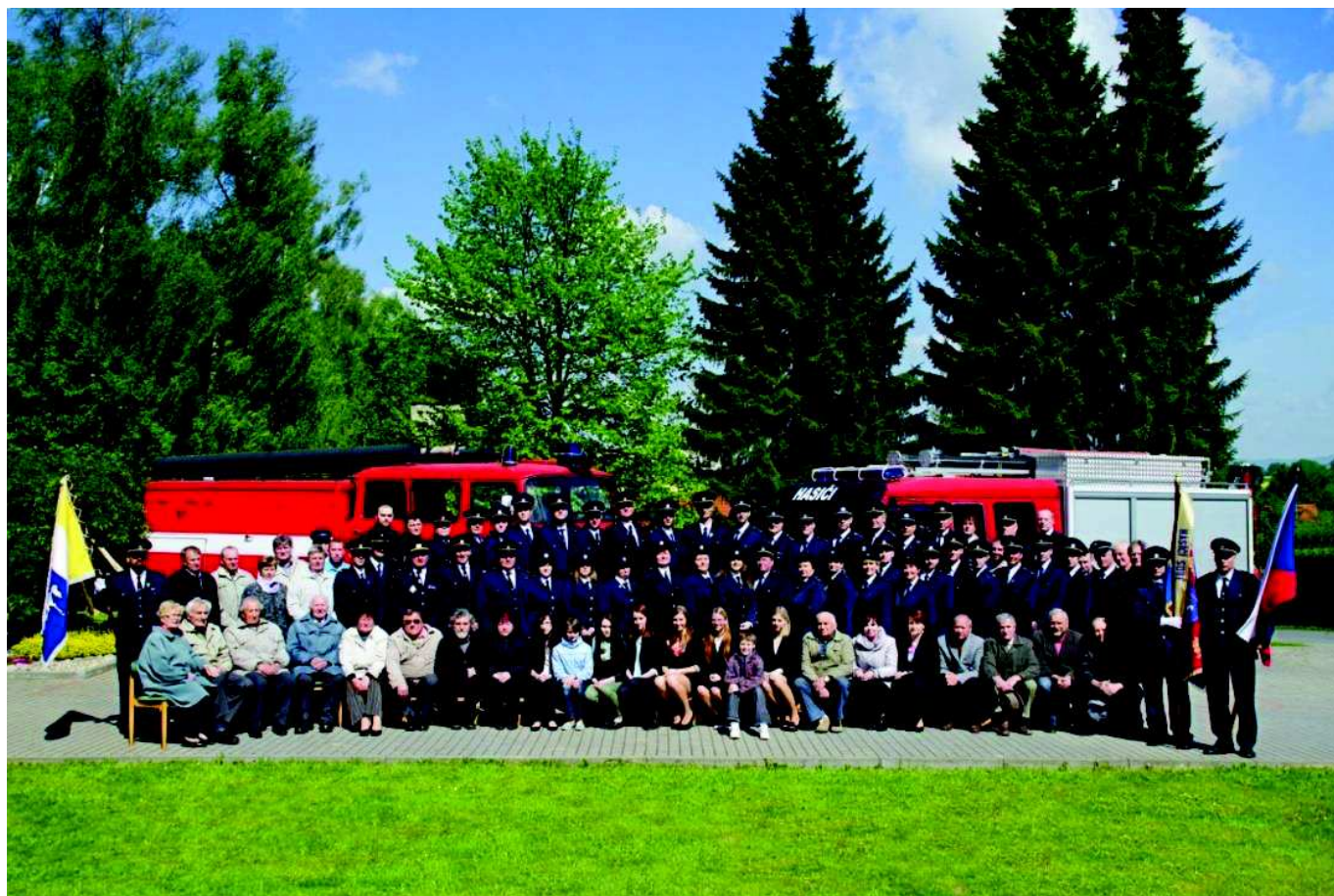
Hasiči rok 2014