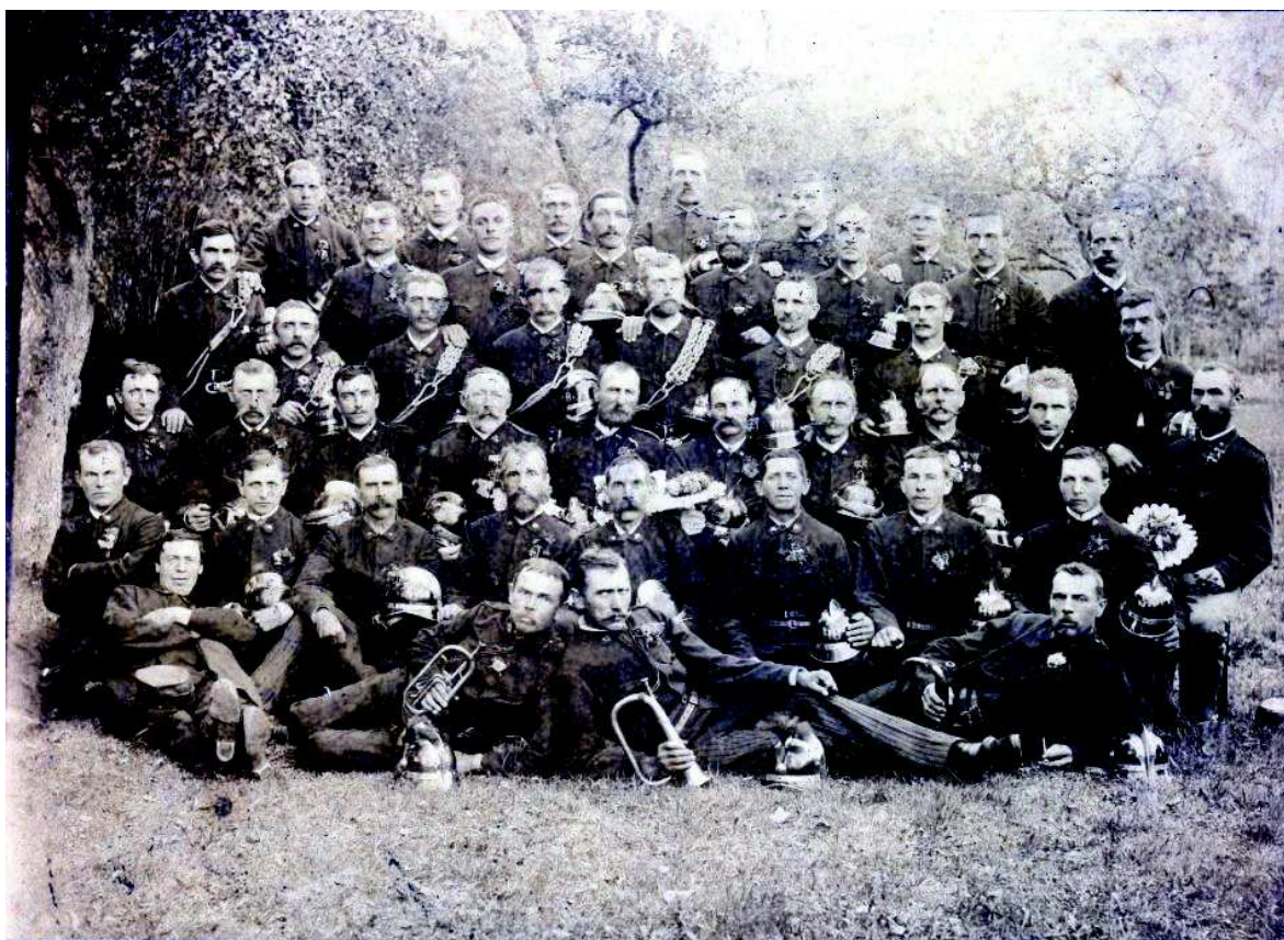
Oslava 10 let od založení sboru (1894) č. 30

Vypsáno z kroniky obce Bernartice nad Odrou, knih Od pokolení do pokolení a Bernartice nad Odrou.