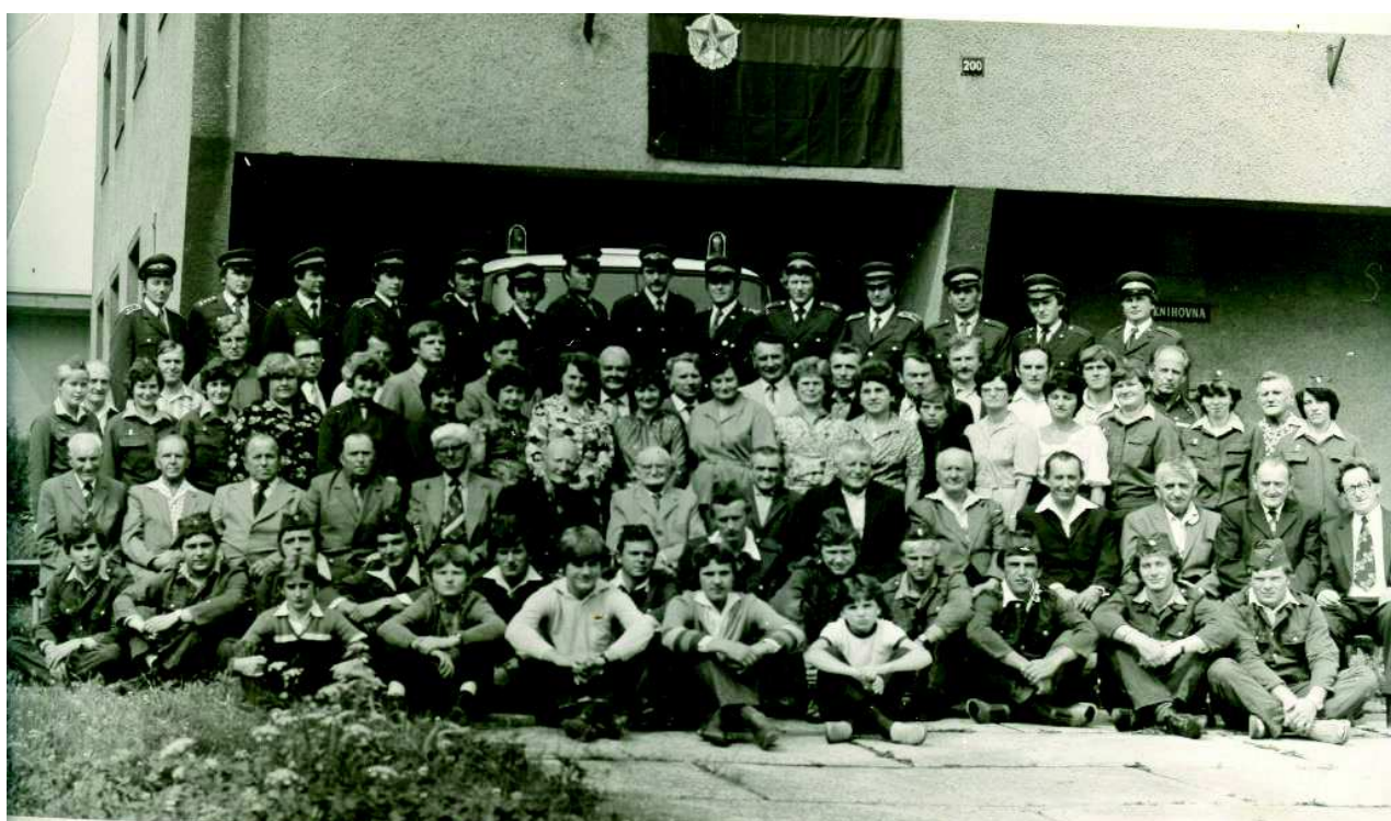
Hasiči rok 1983