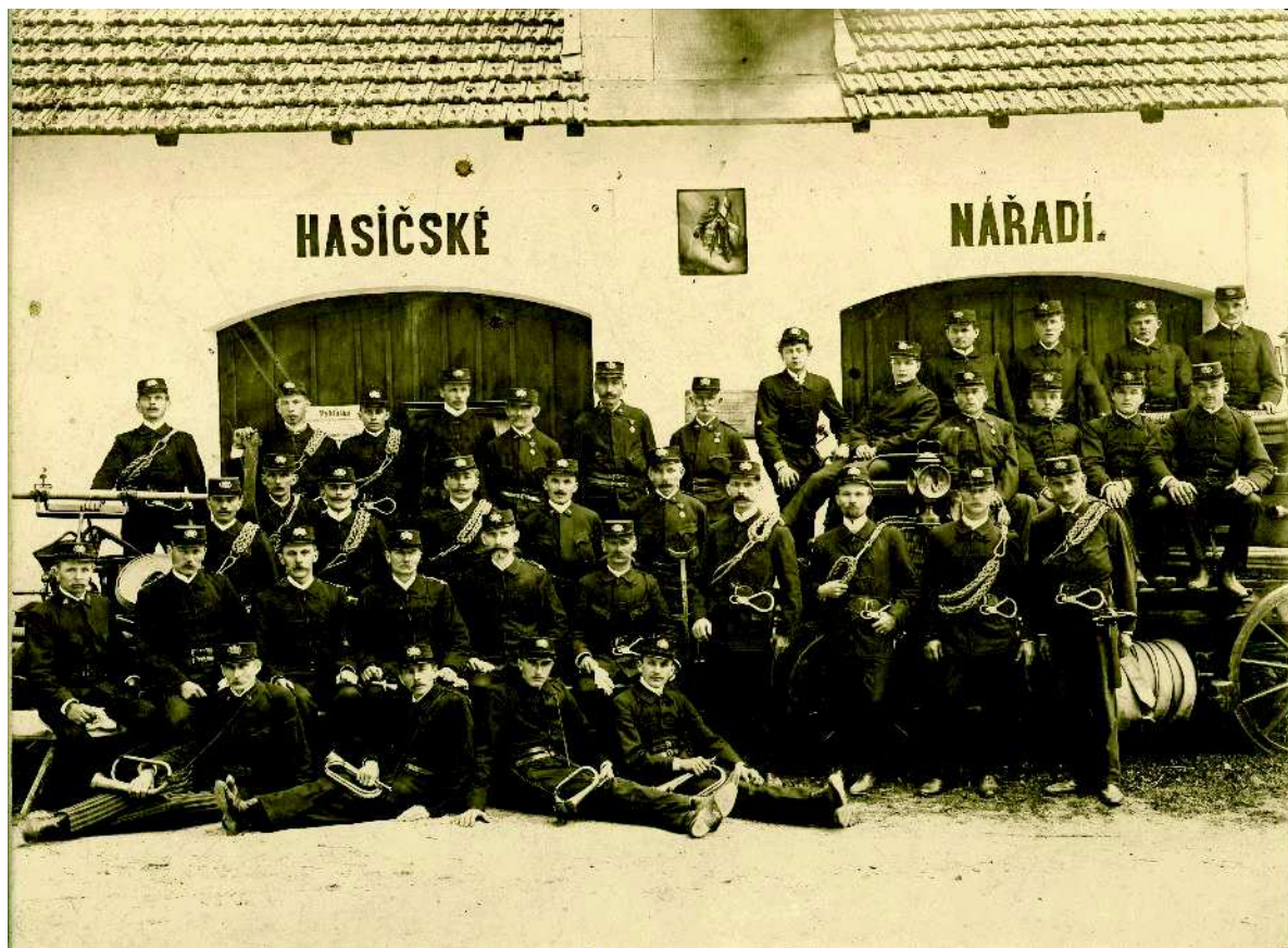
Hasiči rok 1909