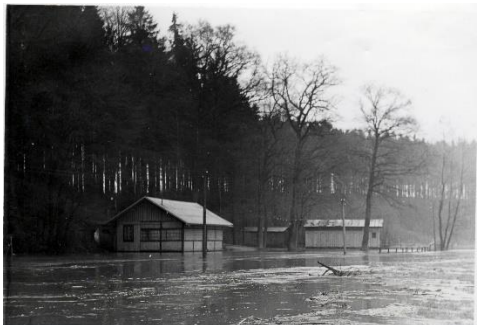
U Odry rok 1972

Protékající řeka Odra přinášela pravidelně povodně, z nichž některé byly většího rozsahu a přinášely občanům hmotné škody na majetku. Památné je krupobití a blesková povodeň v roce 1756, kdy bouře zpusťovala dolní část obce, zvané Krasno. Historie se zopakovala v roce 2009. Blesková povodeň velmi poškodila dolní část obce, místní části Teplica a Krasno. Velká voda přišla v letech 1966 a 1970 a 1997.