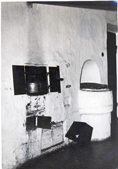
Pekárka č. 111