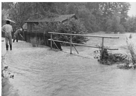
na Teplici rok 1970