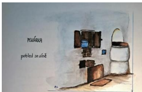
nákres Leopold Biskup