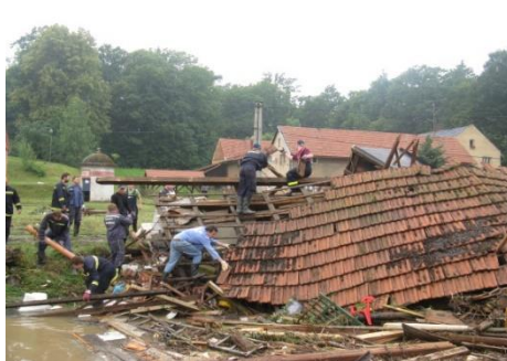
u vodárny 2009

Podrobně jsem tuto tématiku popsala ve Zpravodajích: Nemoci, epidemie 2/2020, Přírodní jevy 3/2021.