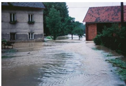
Lesní mlýn 1997