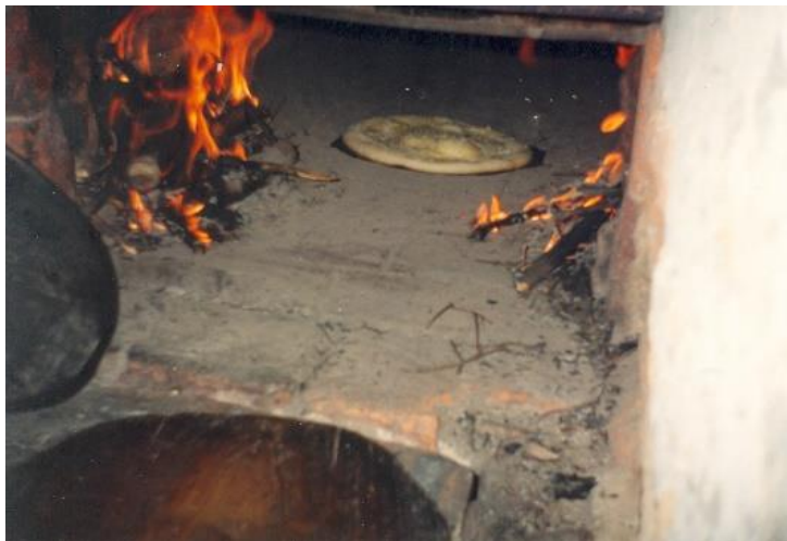
koláč v peci

Na tomto místě je ještě nutné připomenout pečení velkých kulatých Bernartských koláčů, které jsou velmi chutné, ojedinělé a v okolí vyhlášené. Dříve se pekly v pecích, kterým se říkalo pekárky a byly na všech gruntech. Neobešla se bez nich žádná svatba nebo slavnost. Postupně pekárky vymizely, ale umění upéct koláče přetrvalo.