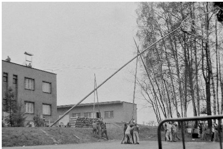
stavění máje rok 1984